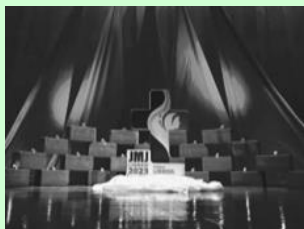
Fotografia vencedora do Concurso.

Contados todos os votos, anunciamos que a grande vencedora foi a fotografia número 7, tirada pela Carolina Contente, com 31 deses votos.